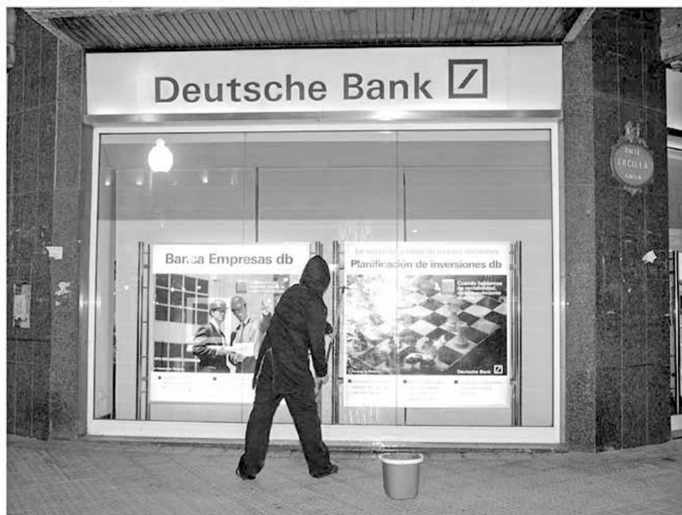
Aportación de trabajo gratuito al Grupo Deutsche Bank. Los cristales de una Sucursal de Deutsche Bank fueron limpiados sin recibir a cambio remuneración alguna.

B/w photograph 82 x 100 cm. DVD 5 W/B without sound.