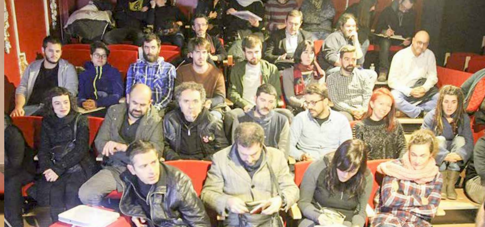
“Ya no hay artistas ni público sino miembros de una comunidad”. Allan Kaprow.